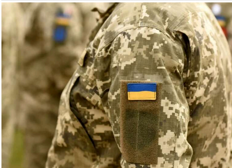
На Івано-Франківщині суд оштрафував сержанта ППО, який не вийшов на зв'язок під час повітряної тривоги

Сержанта ППО оштрафували на 17 тисяч гривень за те, що він не відреагував на загрозу обстрілу і не вийшов на зв'язок під час повітряної тривоги.