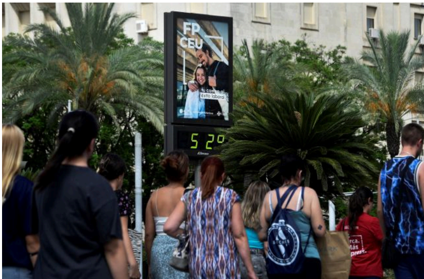
Фото: спека у Європі (Getty Images)