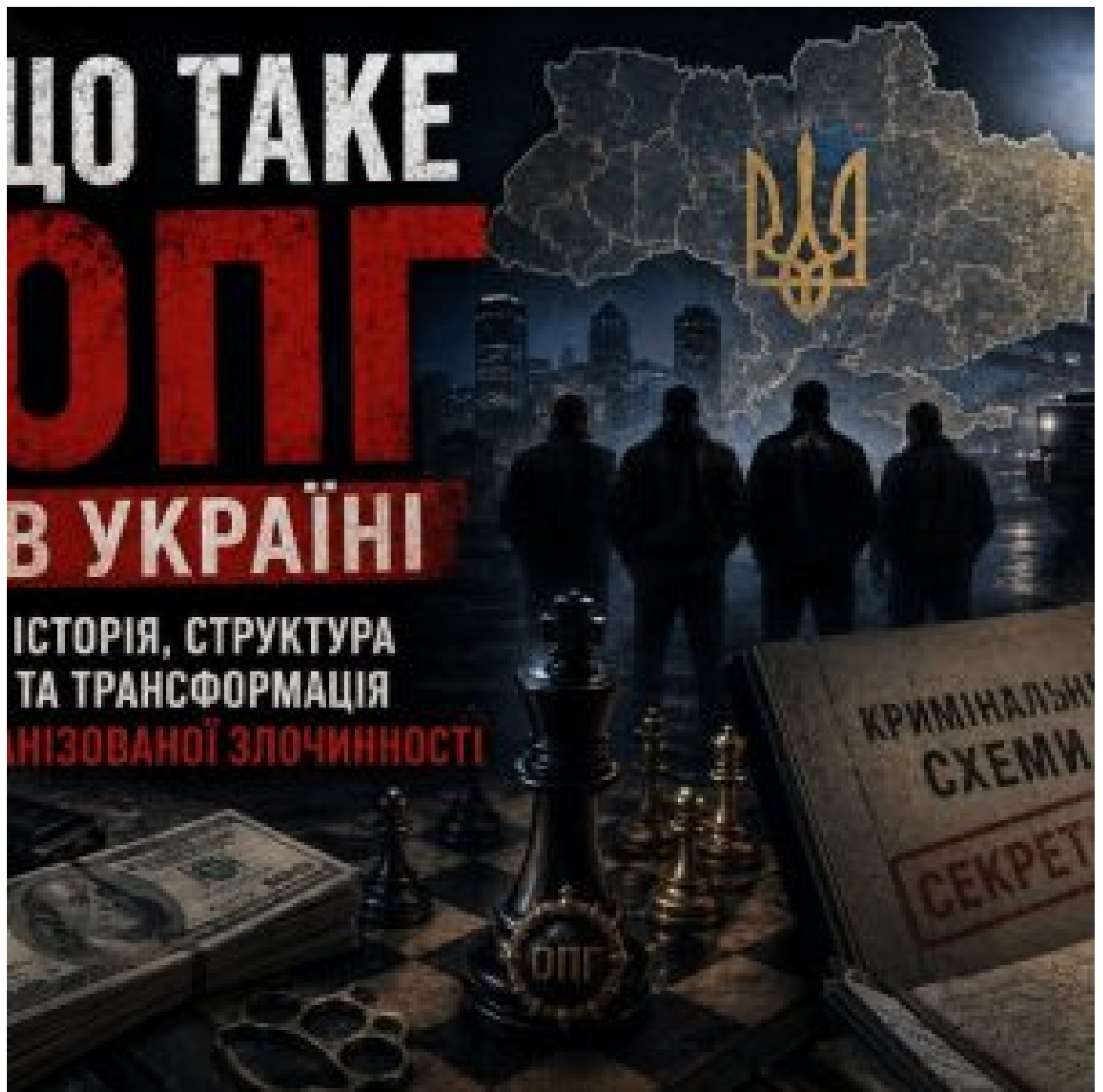
Що таке ОПГ в Україні: історія, структура та трансформація організованої злочинності