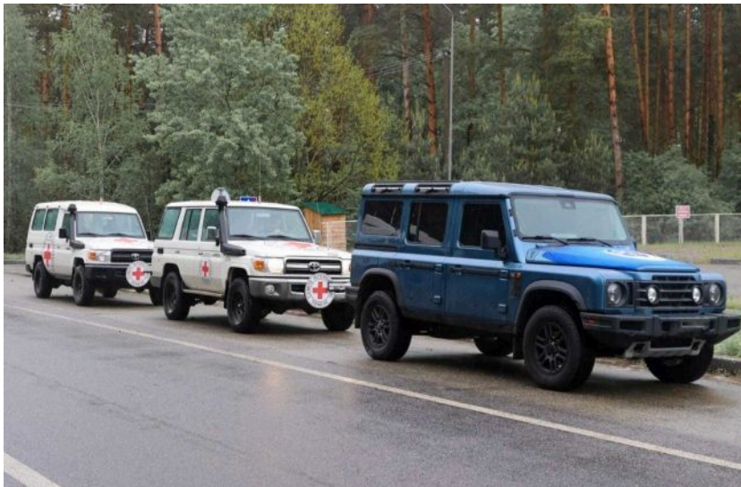
Фото: в Україну повернули ще понад 500 тіл загиблих (t.me/Koord_shtab)