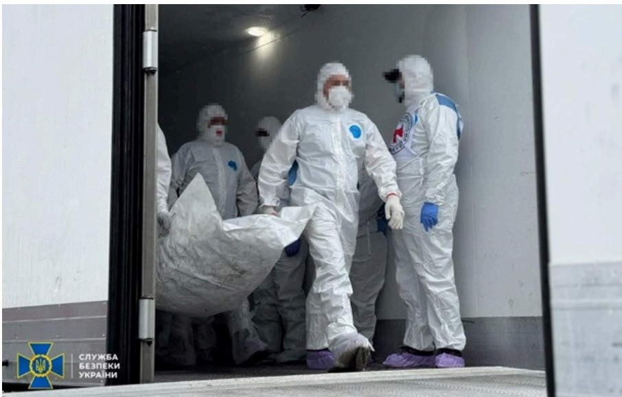
"На щіті" повернулись 528 героїв

Будуть проведені всі необхідні експертизи та ідентифікація репатрійованих тіл, запевнили в Коордштабі.