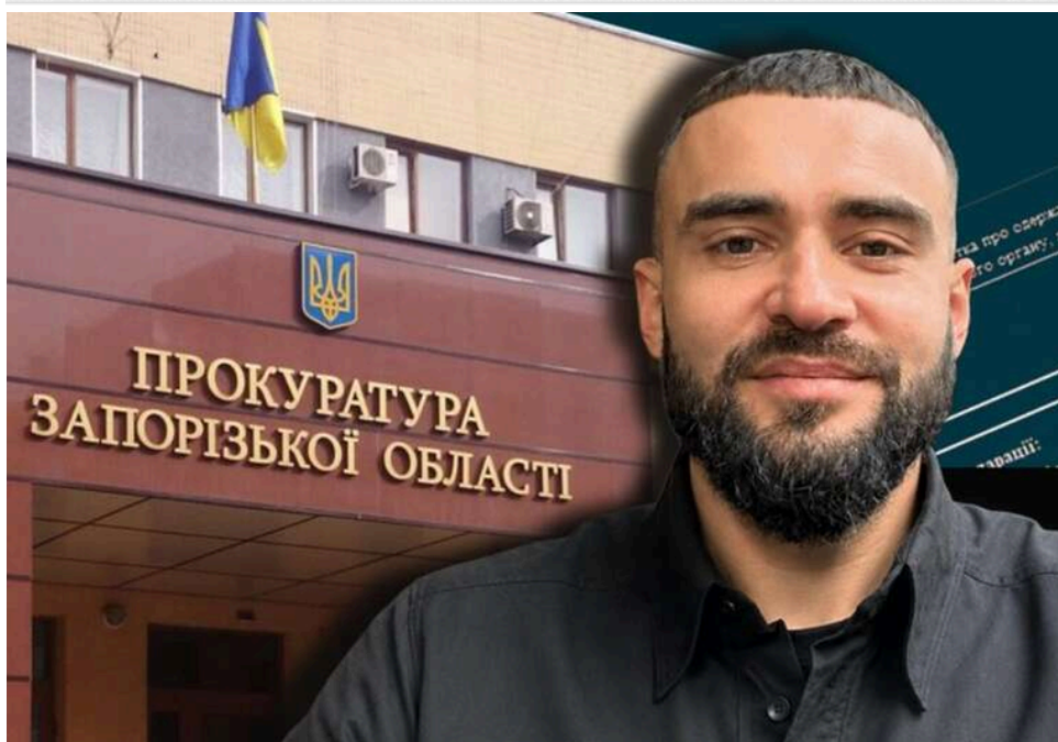
Пів мільйона приросту, автосхеми та дві орендовані квартири: що задекларував головний прокурор Запоріжжя Ярослав Михальчук

Ярослав Михальчук вже майже рік керує Запорізькою обласною прокуратурою. Доходи прокурора зросли на пів мільйона гривень, також Михальчук встиг купити й продати автівку.