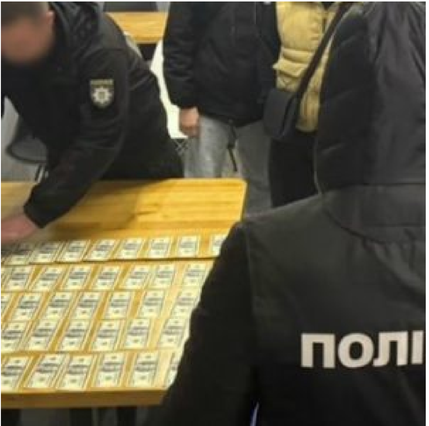
Корупція в силових органах: викриття та наслідки