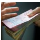
Хто такі корупціонери: ознаки та механізми роботи