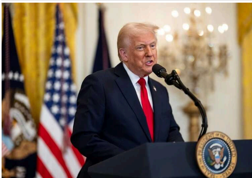
Президент США закликав Китай і Тайвань "пригальмувати" у конфлікті навколо острова

Трамп вважає, що Китай не атакуватиме Тайвань, якщо той сам не вживатиме різких кроків у вигляді оголошення незалежності.