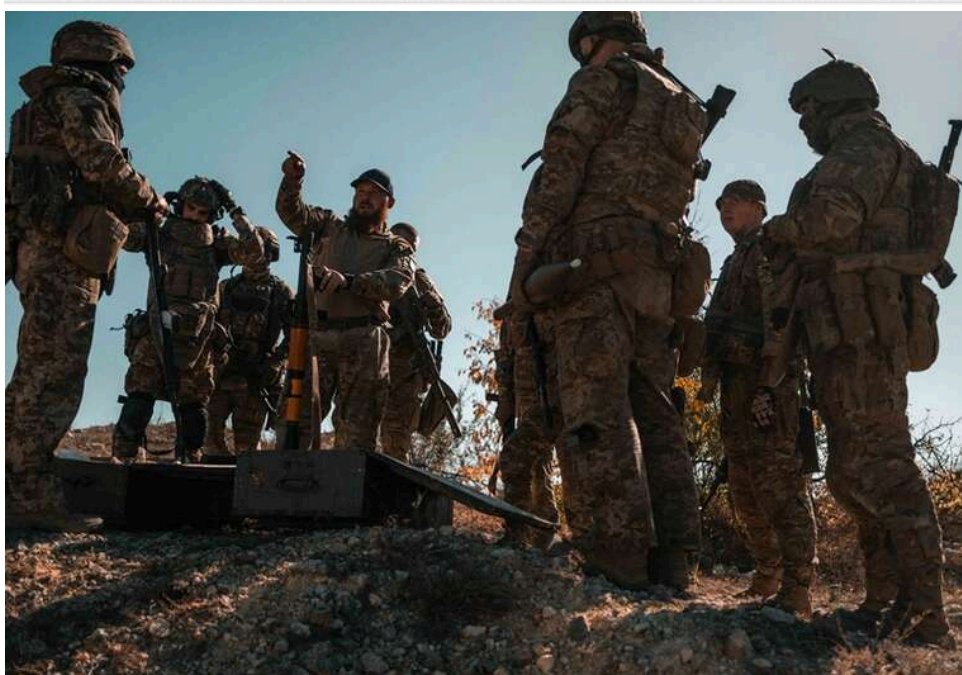
Ситуація на фронті: зафіксовано 263 бойових зіткнення, найгарячіша ситуація на Покровському та Гуляйпільському напрямках

Розпочалася 1543-та доба широкомасштабної збройної агресії РФ проти України. Загалом протягом минулої доби зафіксовано 263 бойових зіткнення.