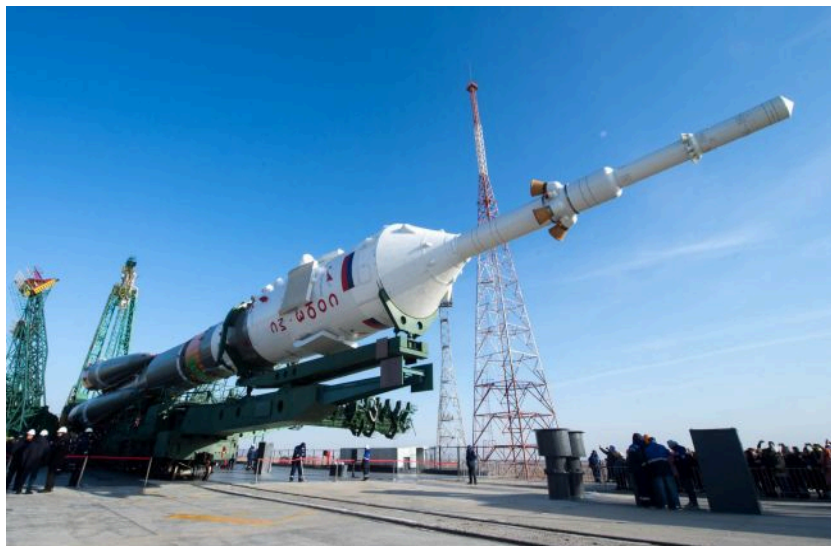
Фото: запуск російської космічної ракети