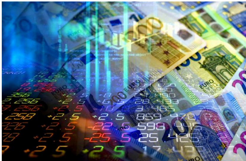
Фото: НБУ може активніше виходити на ринок із валютними інтервенціями (Getty Images)