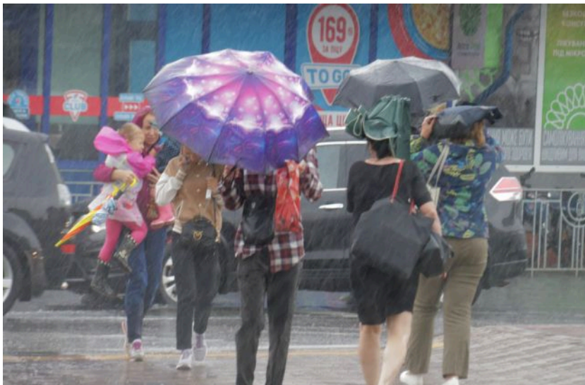
Фото: синоптики дали прогноз погоди на 16 травня