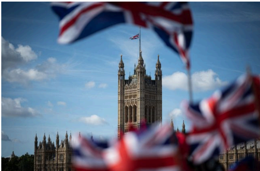
Фото: політична криза у Британії набирає обертів