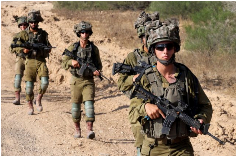
Фото: солдати армії Ізраїлю (Getty Images)