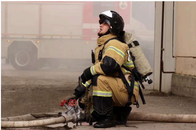
Фото: протягом атаки російська ППО не подавала ознак життя