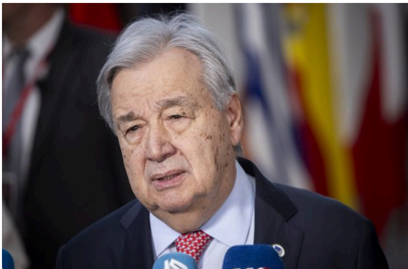
Фото: генеральний секретар ООН Антоніу Гуттеріш