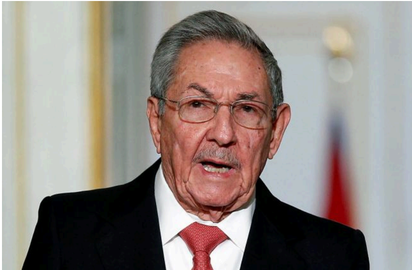
Фото: експрезидент Куби Рауль Кастро