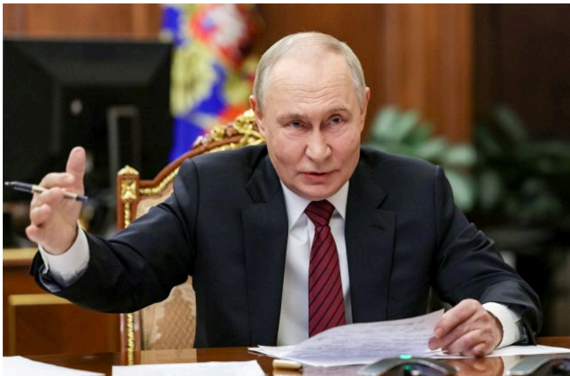
Фото: Володимир Путін, російський диктатор (Getty Images)