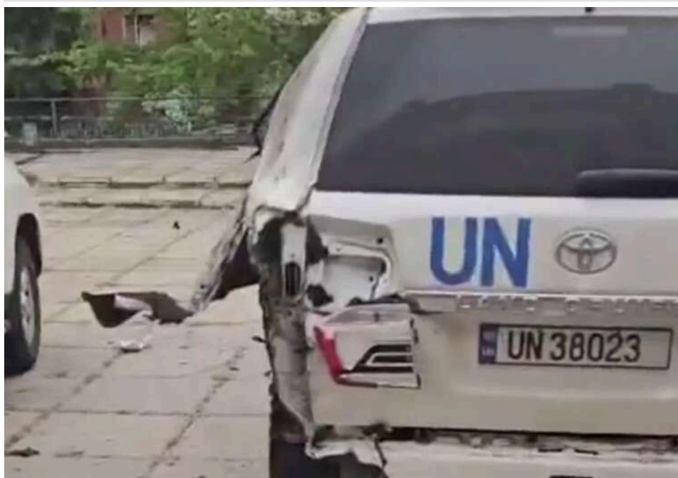
Російський дрон атакував авто ООН у Херсоні: окупанти самі опублікували відео удару

14 травня російський дрон у Херсоні атакував автомобіль Організації Об'єднаних Націй – однак глава гуманітарної місії заявив, що «не знає, хто винен в атаці». При цьому окупанти самі опублікували в мережі відео удару.