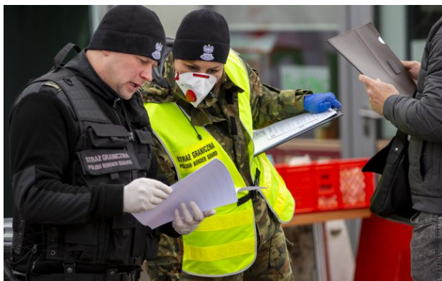
Фото: кордон із Польщею

Прикордонні служби Польщі повідомили, що на пункті пропуску "Медика" у 54-річної громадянки України було виявлено 100-доларову купюру з рівнем радіації, що перевищує допустиму норму в 1905 разів.