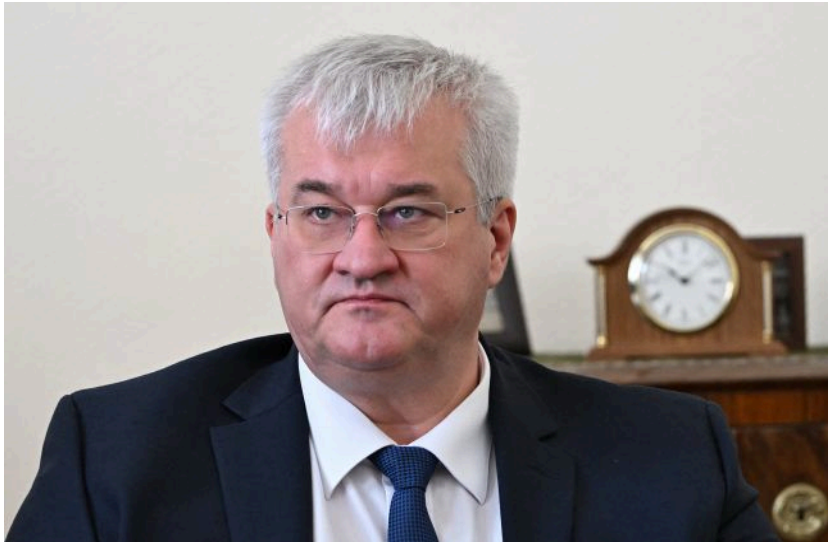
Фото: Андрій Сибіга (GettyImages)