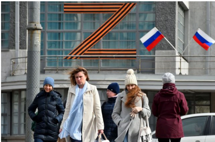
Фото: обстріли РФ хвилюють росіян більше за війну