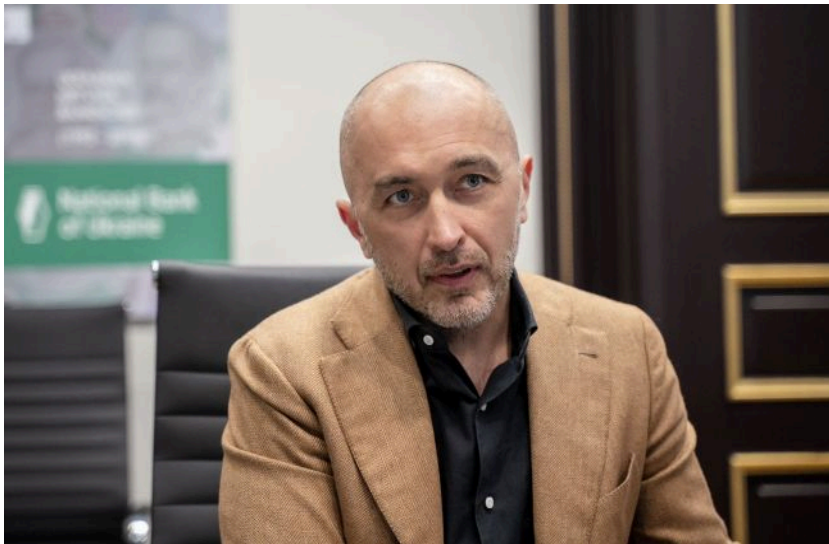
Фото: Коли Україна може отримати 53 млрд доларів (facebook.com NationalBankOfUkraine)