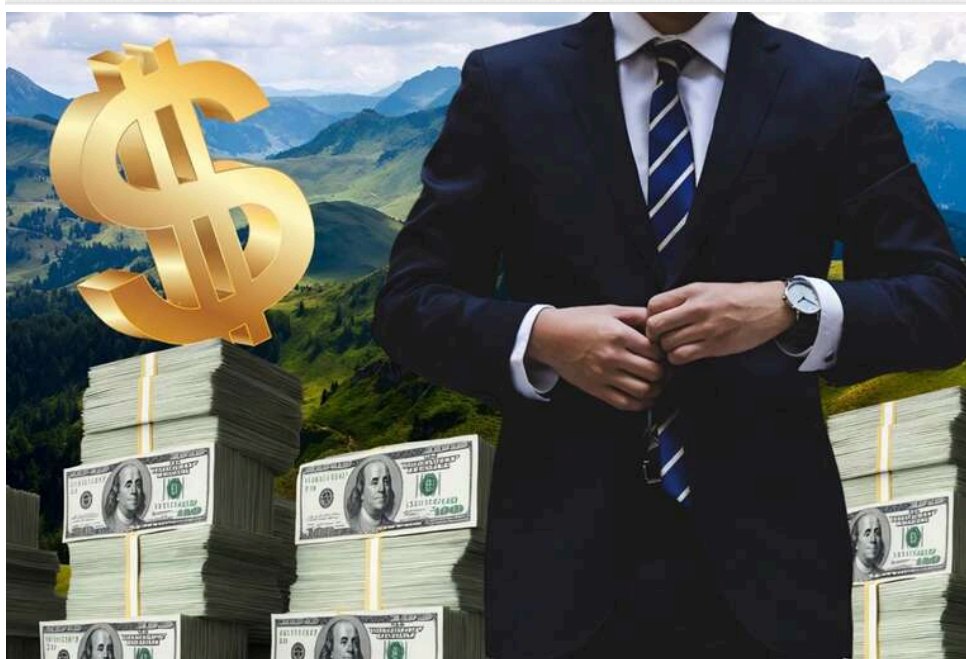
«Мільярдер» із нетрів: як на іракського номінала Алі Чинара Хассана Алі переписали 230 кримінальних фірм Прикарпаття

Одним із "найуспішніших" бізнесменів Прикарпаття сьогодні є нікому не відомий іракський "мільярдер" Алі Чинар Хассан Алі. Проаналізувавши значну частину його "бізнесів" журналісти з'ясували, що, найімовірніше, це класична підставна особа для масової реєстрації сумнівних компаній – так званий "лось".