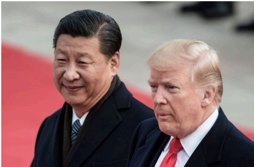
Фото: Дональд Трамп - Сі Цзіньпін