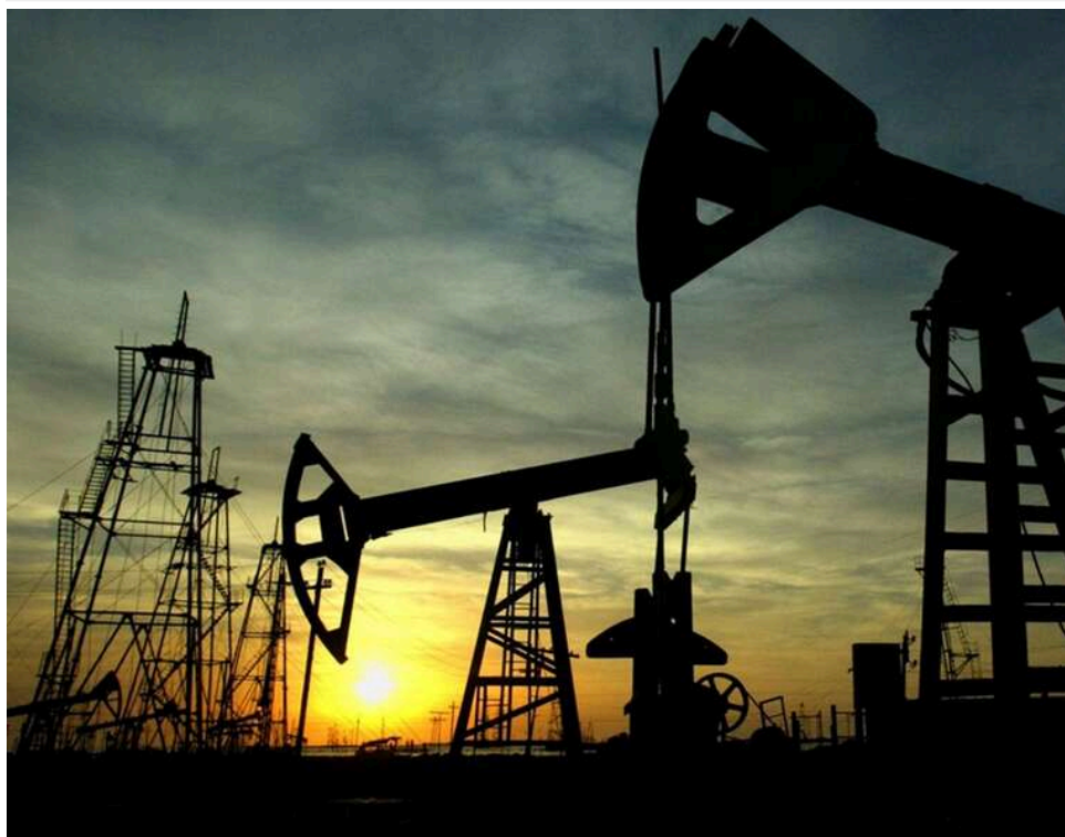
Нафта по 108 доларів та падіння акцій: ринки відреагували на безрезультатний візит Трампа до Китаю

У п'ятницю ціни на нафту значно підскочили, а фондові ринки обвалилися після візиту Трампа до Китаю, який завершився без угоди про припинення війни з Іраном, повідомляє The New York Times.