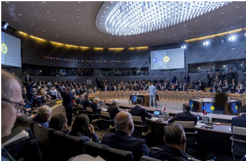
Фото: Рада Україна-НАТО зустрінеться у форматі вечері