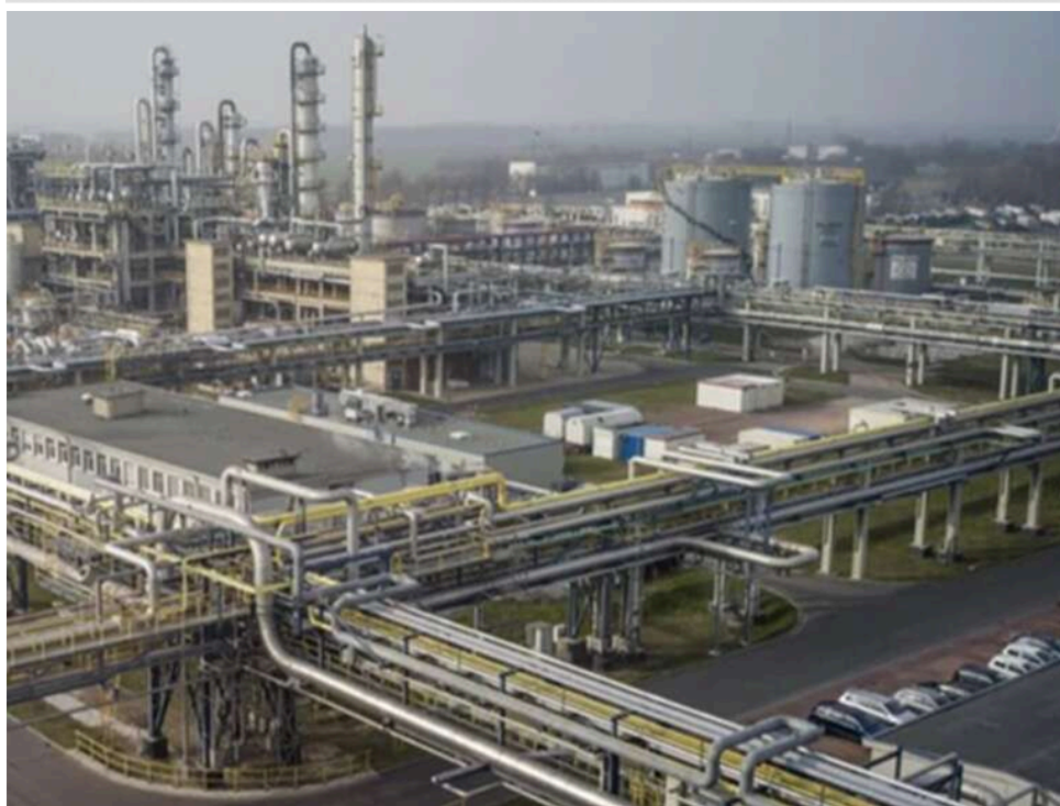
Ефект доміно: війна з Іраном та високі ціни на газ руйнують «серце» європейської хімічної промисловості

Конфлікт з Іраном суттєво погіршує кризу в європейській хімічній галузі, повідомляє Financial Times.