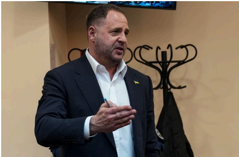
Фото: Андрій Єрмак (Getty Images)