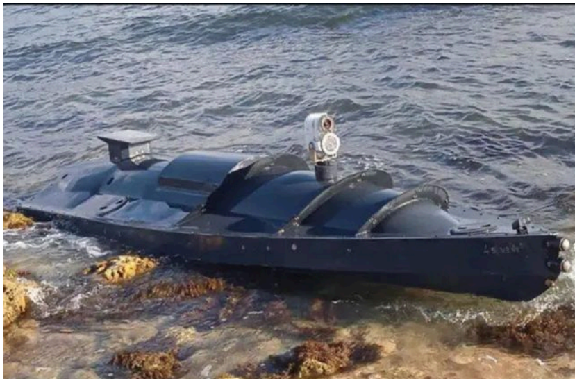
Фото ілюстративне: морський дрон (скріншот з відео)