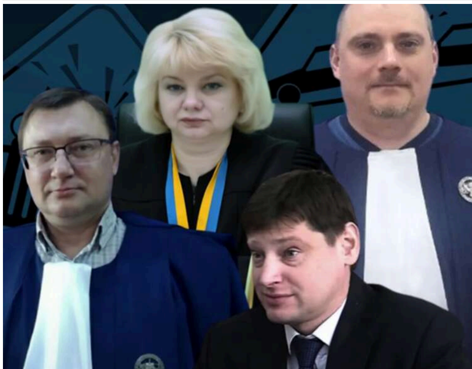
Штраф або права на вибір: як українські судді перетворили безальтернативне покарання для п'яних водіїв на «лайт-версію»

Покарання за керування в нетверезому стані повинно бути жорстким і без варіантів: штраф плюс позбавлення водійських прав. Та на практиці суди все частіше призначають лише одну з санкцій.