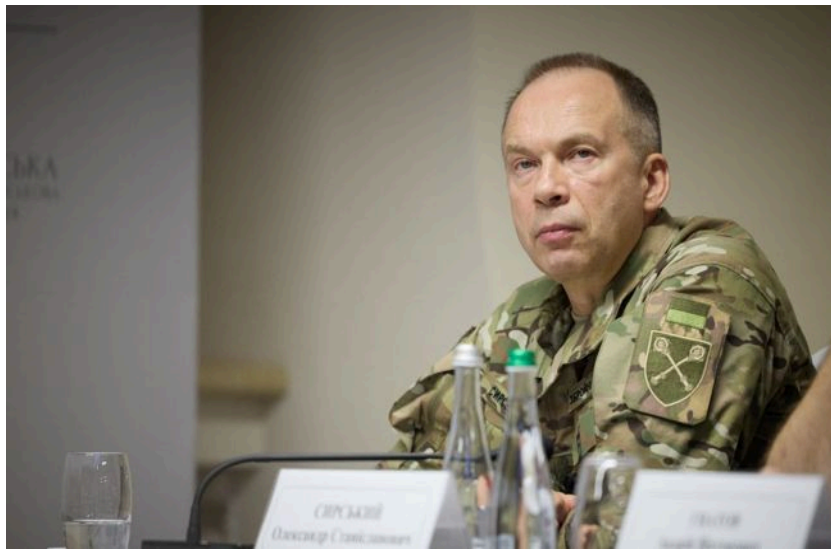
Фото: Головнокомандувач ЗСУ Олександр Сирський