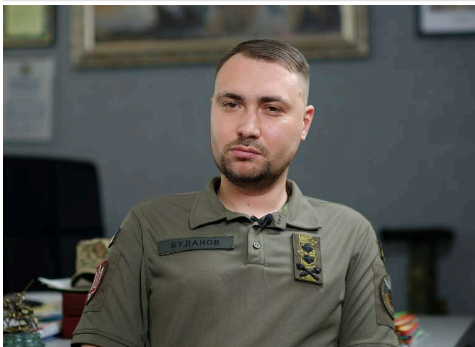
Я не бачу ознак підготовки Росії до ядерного удару, інакше я б про це знав, - Буданов

Страхи перед ядерним ударом Росії, які циркулюють в Україні, є необґрунтованими. При цьому російський ядерний арсенал продовжує становити серйозну небезпеку.