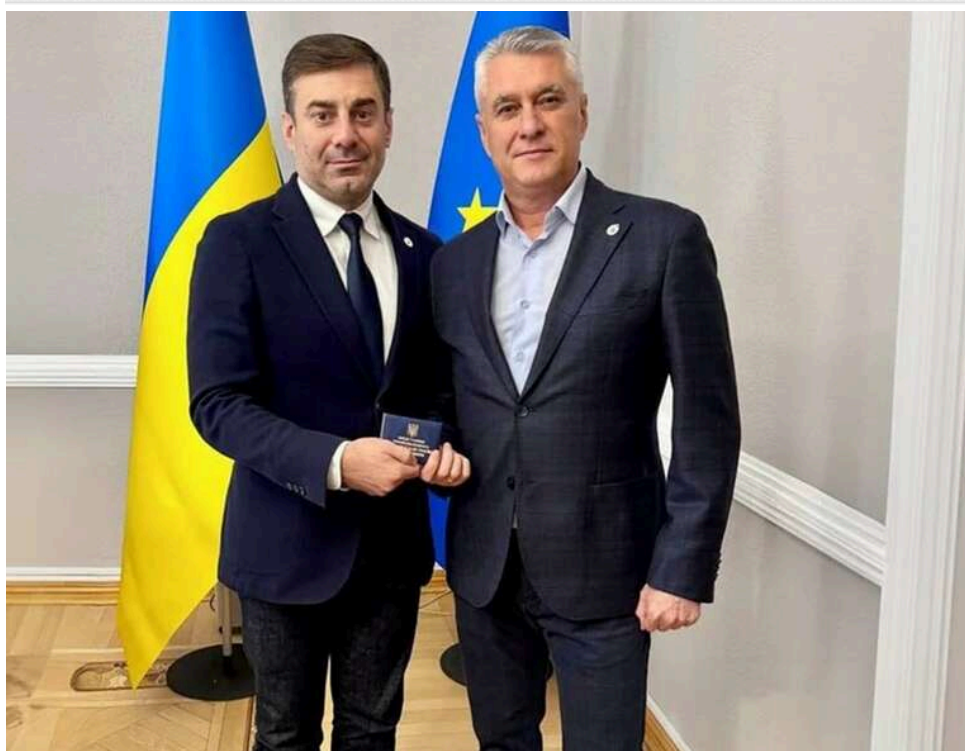
З прокурорського крісла – в омбудсмени: шлях Анатолія Ковальчука від «бурштинових» та «хабарницьких» скандалів до нової посади