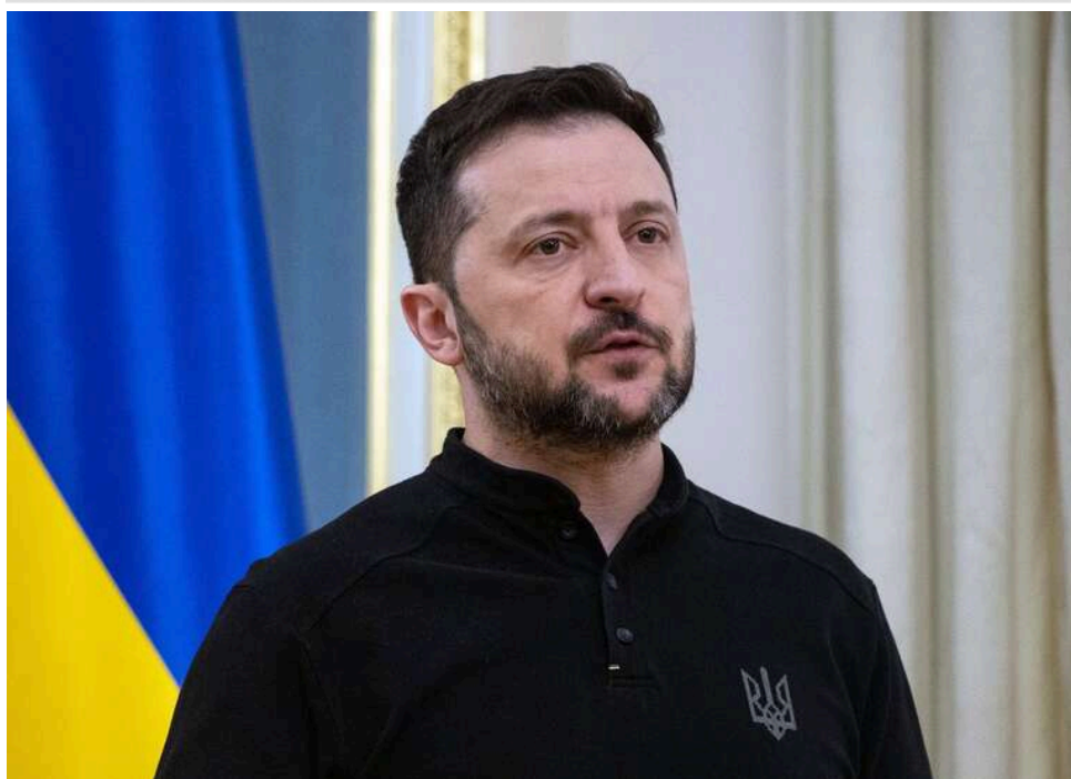
Конституційний імунітет президента під час війни: чому Зеленський юридично недосяжний для НАБУ