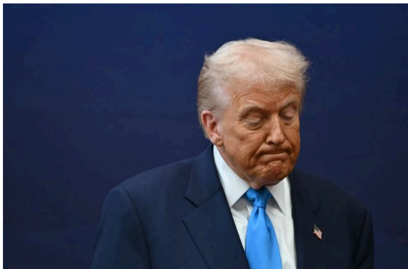
Фото: Після заяви Трампа акції Boeing впали на 4% (Getty Images)