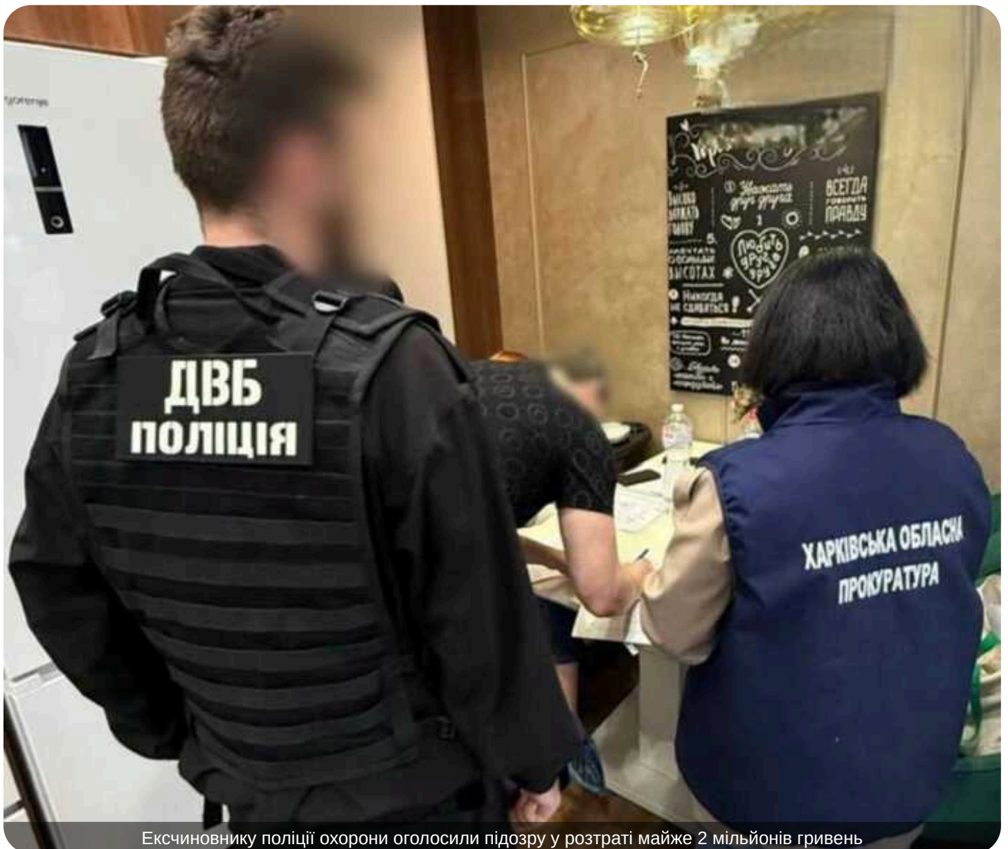
Ексчиновнику поліції охорони оголосили підозру у розтраті майже 2 мільйонів гривень

Прокурор Харківської обласної прокуратури повідомив про підозру експосадовцю Управління поліції охорони. Він підозрюється у розтраті майже