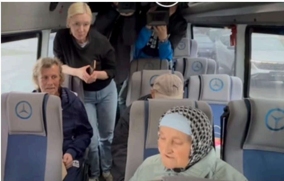
Серед повернутих - цивільні громадяни віком від 61 до 85 років

Цивільні громадяни віком від 61 до 85 років були насильно вивезені російськими військовими у 2025 році.