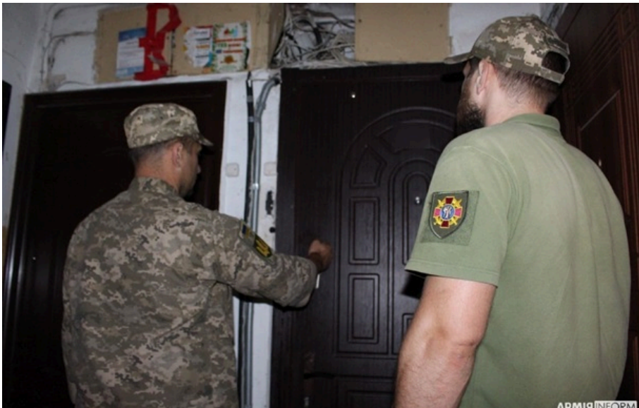
В Україні посилюють мобілізаційні заходи

У Київському територіальному центрі комплектування та соціальної підтримки підтвердили, що є вимога посилити мобілізаційні заходи.