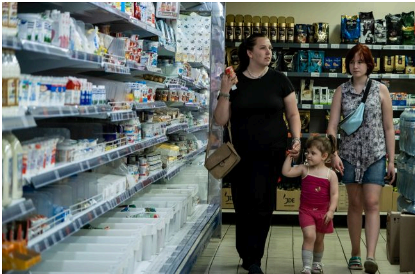
Родина в супермаркеті Миколаєва