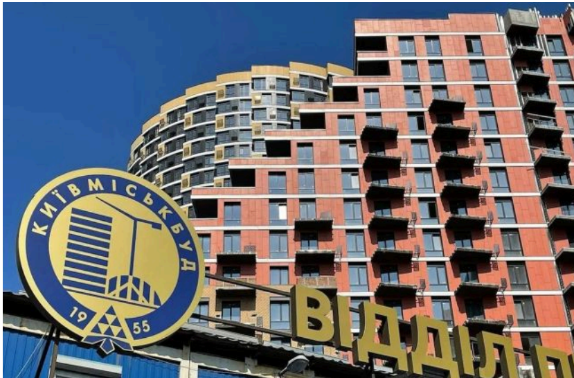
У "Київміськбуд" повідомили терміни передачі житла інвесторам