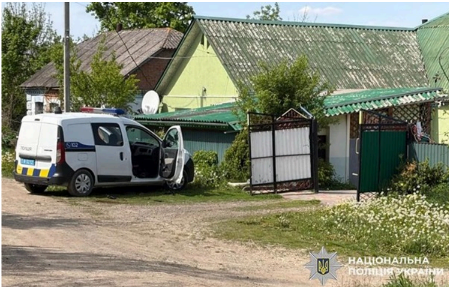
Обставини та мотиви злочину встановлюються

Один поліцейський загинув, ще один отримав тілесні ушкодження. Наразі розшукують чоловіка, причетного до нападу.