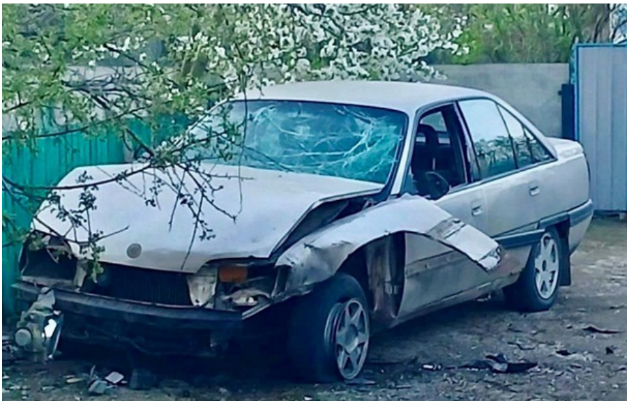
Пошкоджений внаслідок російського обстрілу автомобіль

Внаслідок російських ударів по Дніпропетровщині загинула 11-річна дитина, п'ятеро дорослих дістали поранення.