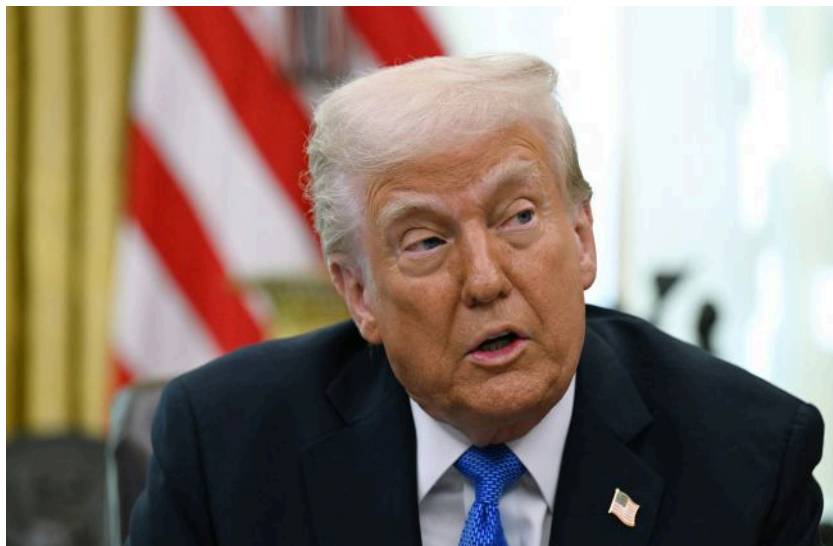
Фото: Дональд Трамп (GettyImages)