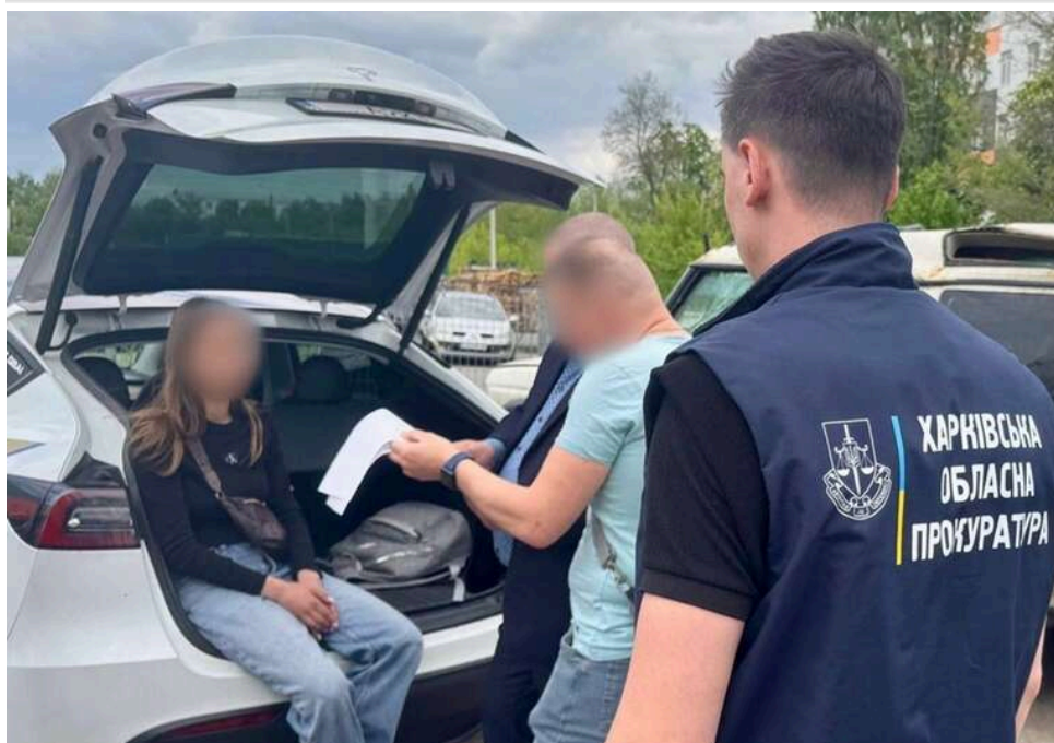
У Харкові викрили схему контрабанди авто для ЗСУ: блогерку підозрюють у продажу гуманітарних машин

Правоохоронці викрили масштабну схему контрабанди автомобілів, яку організувала відома харківська блогерка - керівниця благодійного фонду. Прикриваючись допомогою армії, псевдоволонтерка збудувала цілий «бізнес» на перепродажі транспортних засобів, призначених для фронту.