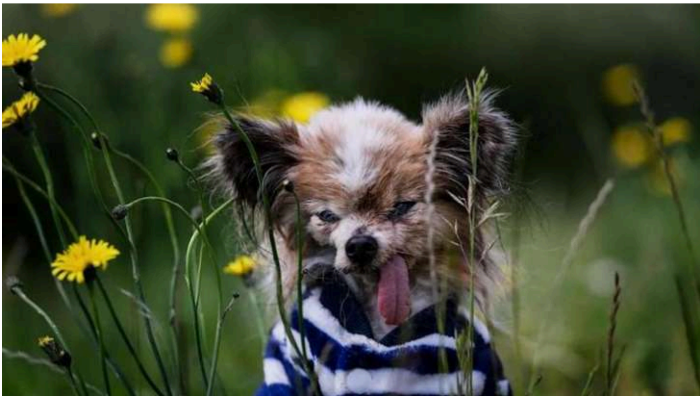
Фото: Той-спаніель на прізвисько Лазар

У Франції 30-річний той-спаніель на прізвисько Лазар може стати найстарішим собакою у світі, передає видання The Times.