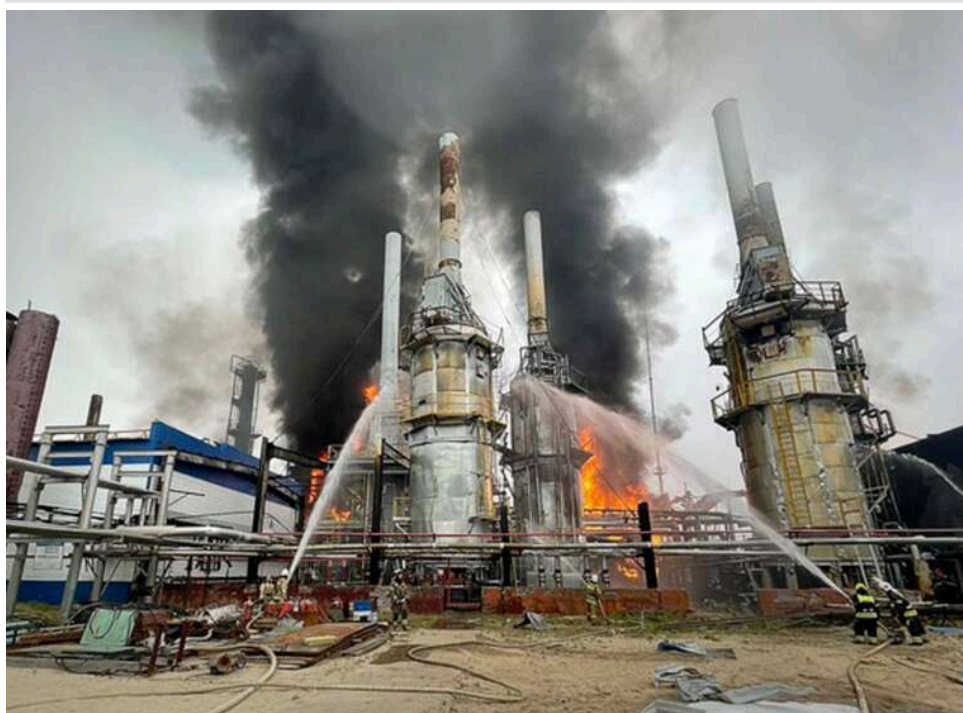
Пожежа після атаки дрона зупинила виробництво палива на заводі «Газпрому» в Астраханській області, – Reuters

Газопереробний завод компанії "Газпром" у Астраханській області на півдні Росії призупинив виробництво моторного палива після пожежі, що сталася 13 травня внаслідок атаки дрона.