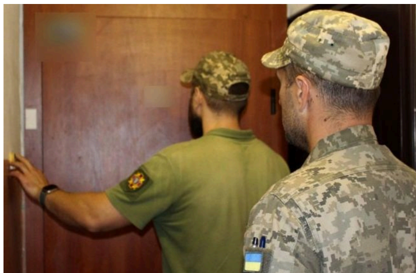
Фото: мобілізація в Києві (кадр відео)