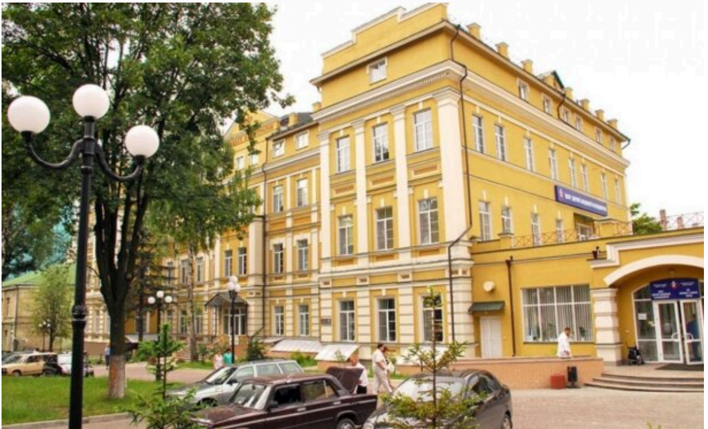
Центр дитячої кардіології та кардіохірургії України

Українські діти, зокрема немовлята та пацієнти з вродженими і набутими вадами серця, потребують безперервної високоспеціалізованої медичної допомоги.