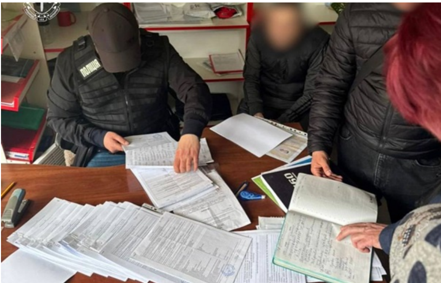
Обнаружен доступ к базе МВД для незаконной регистрации автомобилей

Организаторы создали сеть подконтрольных фирм, которые формально предоставляли услуги комиссионной продажи автомобилей.